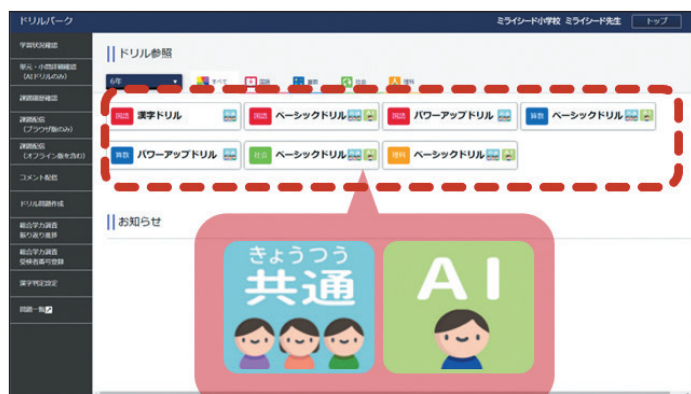
※システムリリース後の画面です。