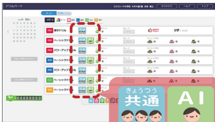
※システムリリース後の画面です。