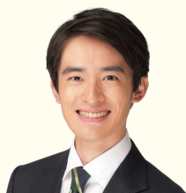
芦屋市市長 高島 峻輔 【ファシリテーター】