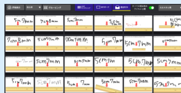
子どもたちが提出したオクリンクカード

定規の目盛りを問う問題を提示し、全員で答えを確認。 定規の目盛りの読み方を復習。